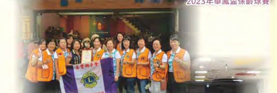
感謝美豐獅子會捐款