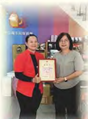
感謝遠通電收股份有限公司捐贈本會排汗衣2箱