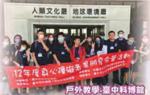
戶外教學-臺中科博館

面對不同的學生，嘗試給予不同的目標與提示的形式。接觸每一個學生，用我僅有的1個小時又50分鐘去觀察學生，想辦法找出方法幫助學生學習。