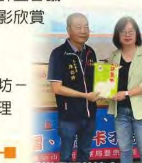
感謝豐原慈濟宮-葫蘆墩媽祖捐贈物資