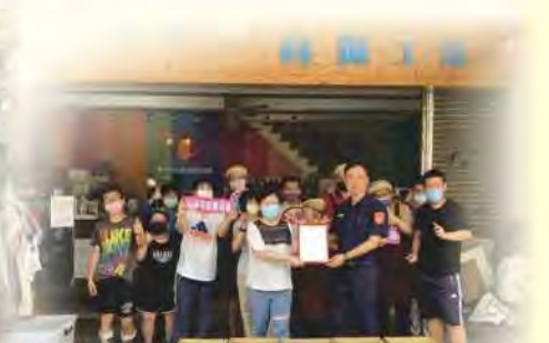
感謝臺中市警察局豐原分局捐贈物資