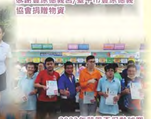
2023年華鳳盃保齡球賽