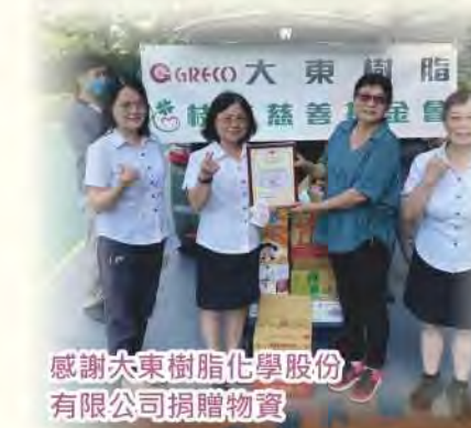
感謝大東樹脂化學股份有限公司捐贈物資