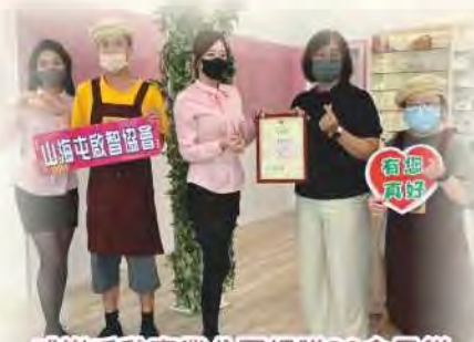
感謝千秋事業公司捐贈20盒月餅給本會中低收入戶