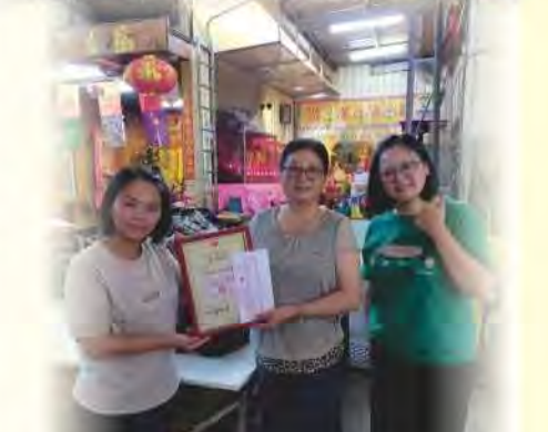
感謝豐原德義宮/臺中市豐原德義協會捐贈物資