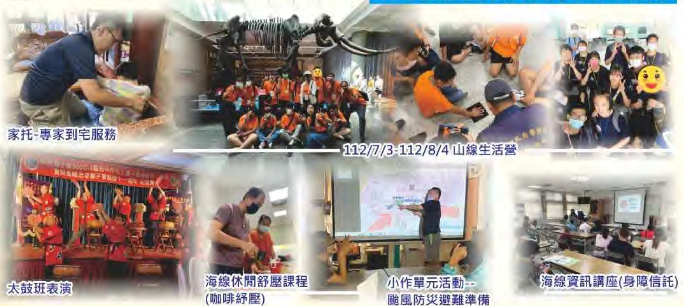
家托-專家到宅服務