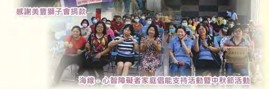
海線-心智障礙者家庭倡能支持活動暨中秋節活動