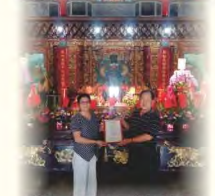
感謝台中神岡大明宮捐贈物資