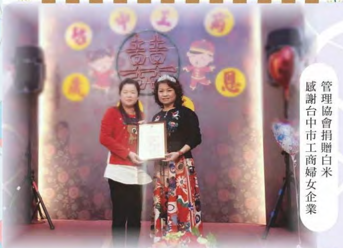
管理協會捐贈白米 感謝台中市工商婦女企業