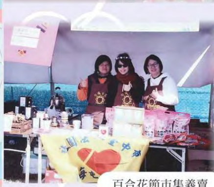
百合花節市集義賣