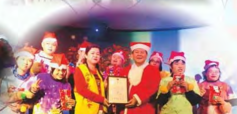
參加大手牽小手圍爐餐會