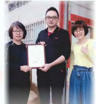
感謝川本國際包裝有限公司 長期捐助本會並捐贈包材