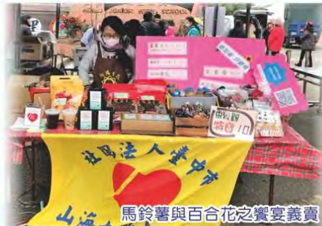
馬鈴薯與百合花之饗宴義賣