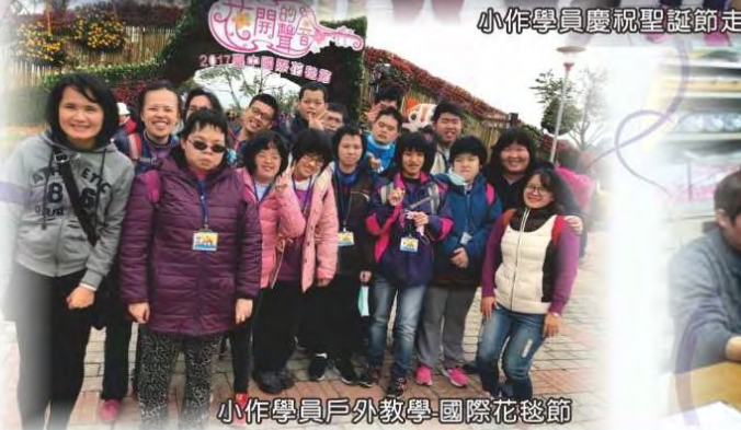
小作學員戶外教學國際花毯節