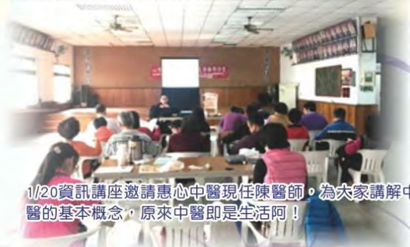
1/20資訊講座邀請惠心中醫現任陳醫師，為大家講解中醫的基本概念，原來中醫即是生活阿！