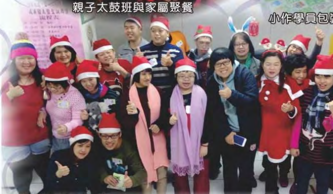
小作學員慶祝聖誕節走秀活動