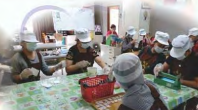
小作學員包裝咖啡作業