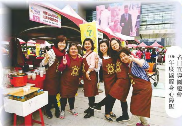
者日宣導園遊會 106年度國際身心障礙