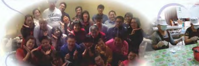
親子太鼓班與家屬聚餐