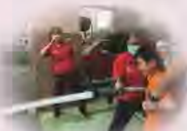
108年度身心障礙者暑期生活營戶外訓練(團隊活動)

這次很開心有機會參加暑期生活營，除了能帶給學生不一樣的暑假，也讓我學習到許多在課本上學不到的知識與經驗。此營隊也讓我能有較長時間與學生相處，漸漸去熟悉、了解每位學生的優點以及狀況，我認為這對於帶領學生是件很有幫助的事。在生活營我們需要自己設計課程與上台教課，這也是我認為收穫最大的一部分。