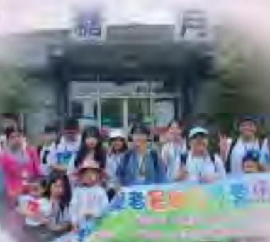
108年度身心障礙者暑期生活營戶外訓練