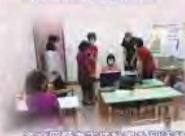
安排課程內容及時間並協助學員完成課程