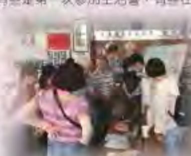
這在個展上學習-咖啡課程