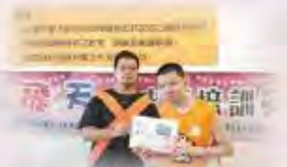
第七屆生之光繪畫徵選