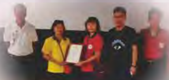
感謝臺中市愛幼會-提供愛心電影欣賞

臺中市政府警察局豐原分局率領豐原慈濟宮-葫蘆墩媽祖 樂天宮、豐原警友站、豐原武德宮財神廟 豐原白沙屯媽祖文化協進會等單位捐贈物資