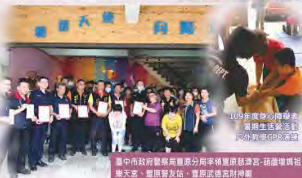
109年度身心障礙者 暑期生活營活動 戶外教學GPR演說

臺中市政府警察局豐原分局率領豐原慈濟宮-葫蘆墩媽祖 樂天宮、豐原警友站、豐原武德宮財神廟 豐原白沙屯媽祖文化協進會等單位捐贈物資