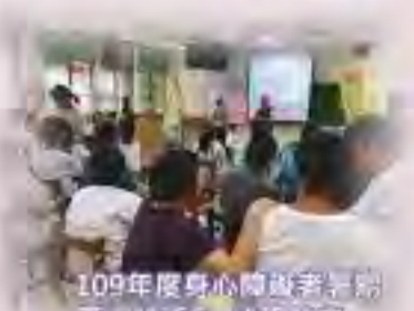
109年度身心障礙者暑期生活營戶外訓練(團隊活動)