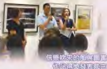
信譽致來的家庭照顧 作服務與社區感