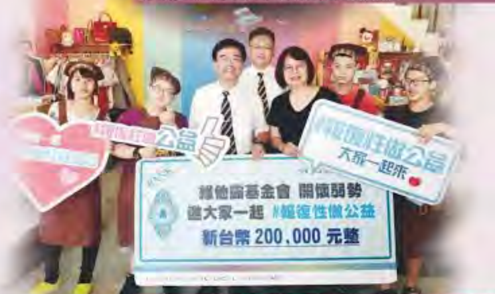
感謝維他露基金會捐款-報復性做公益-大家一起來