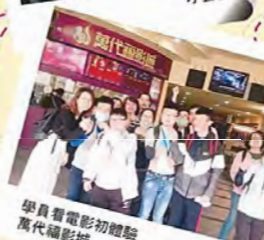
學員看電影初體驗 萬代福影城