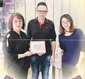
威爾川本國際包裝有限公司長期關懷