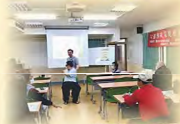
山線資訊講座—脊椎保健