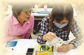
屯區關懷支持—咖啡舒展