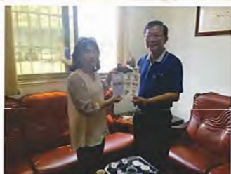
拜訪鴻錫機械股份有限公司劉總經理 感謝支持贊助本會