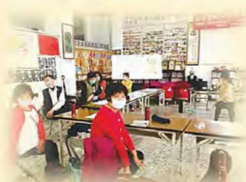
海線資訊講座—身障者居家復能