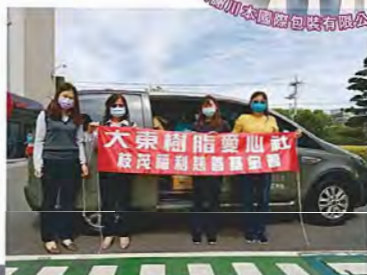
捐贈物資義賣品 大東樹脂化學股份有限公司