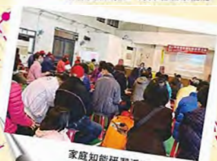
家庭知能研習活動